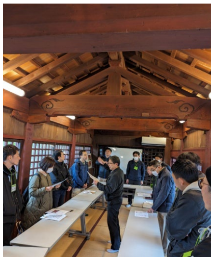
R5年度 現地講義の風景(東照宮)

※全課程修了者には、修了証を発行しヘリテージマネージャー(歴史的建造物保存活用資格者)として公益社団法人広島県建築士会に登録します (R8年4月1日現在 258名登録)