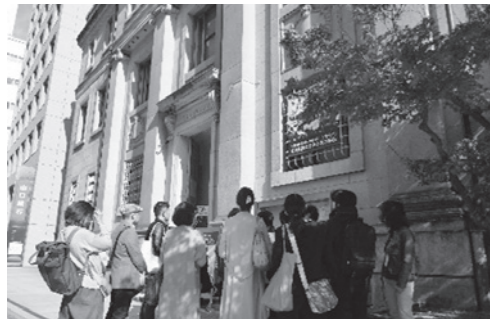
本通り界隈の建築めぐり…都心部の様々な建築を見て歩くツアー