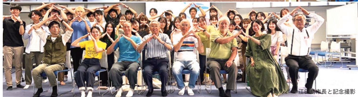
江田島市長と記念撮影

MONTHLY 建築士 HIROSHIMA No.176 令和4年10月1日発行 発行 公益社団法人 広島県建築士会 〒730-0052 広島市中区千田町3丁目7番47号 TEL(082)244-6830(代) FAX(082)244-3840 URL http://www.k-hiroshima.or.jp/ e-mail: info@k-hiroshima.or.jp