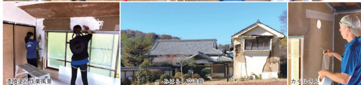
漆喰塗り作業風景