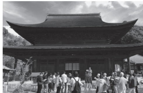
不動院金堂…広島市内唯一の国宝建築を専門家による解説と共に特別に見学