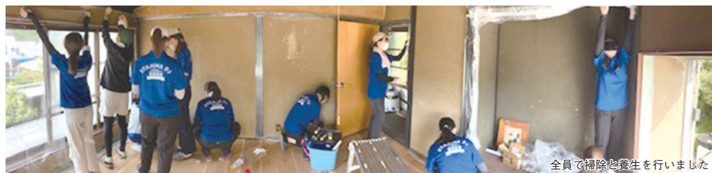
全員で掃除と養生を行いました