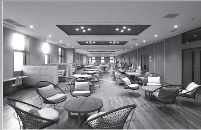
多目的ホール「ばるて」

3～6階の病棟階は、各階2つずつの病棟が配置され、看護の看守り(気配り)が行き届くように病室が配置されており、安全・安心を感じられる病棟を目指した。スタッフステーションは向かい合って配置され、連携して看護業務を行う。病室は「1床室」、「4床室」、障子で仕切られた「個室風多床室」が配置され、プライバシーと看護を両立させている。