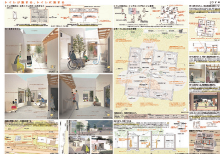
最優秀作品賞「トイレが集まる、トイレに集まる」 横浜国立大学・大学院Y-GSA 植田雅人、前本哲志、宮本皓章