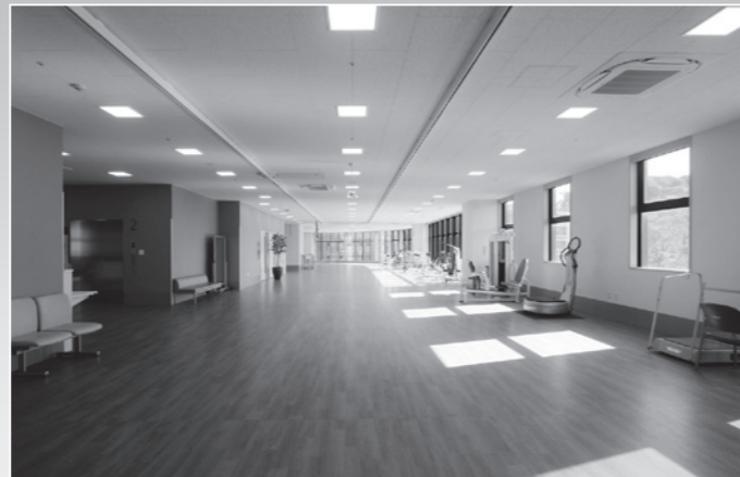
リハビリステーション