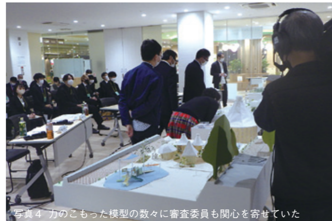
写真4 力のこもった模型の数々に審査委員も関心を寄せていた