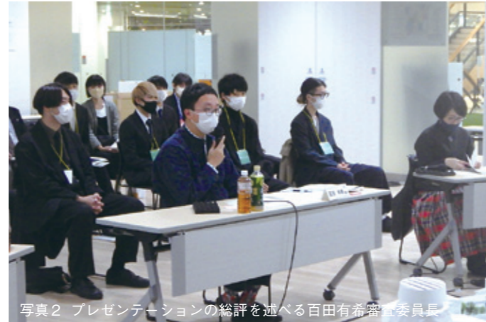
写真2 プレゼンテーションの総評を述べる百田有希審査委員長

なお、最優秀作品に選ばれた作品は今年度設計を進め、来年度に竣工予定となっております。