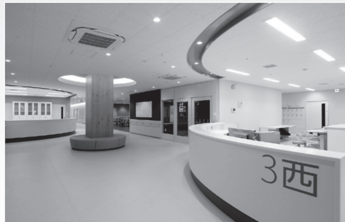
病棟ロビーホール