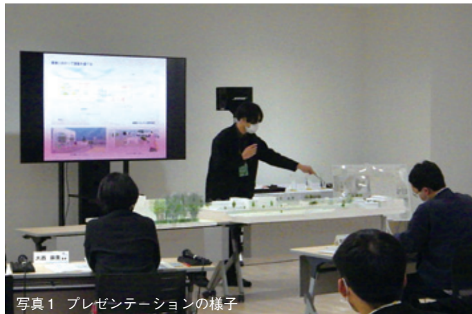
写真1 プレゼンテーションの様子