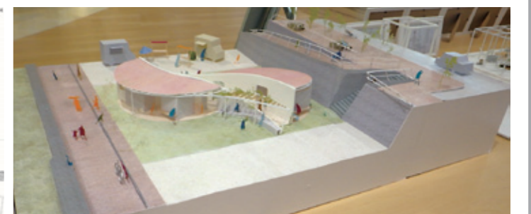
優秀作品賞「あそびと遊びのあるトイレ」 東京理科大学 青木廉、平澤美織