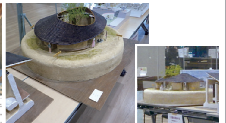
優秀作品賞「ふわりくぐり」 広島大学・大学院 山田誠人、井上龍也、賈剣飛、林恭平