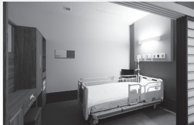
病室(個室風多床室)