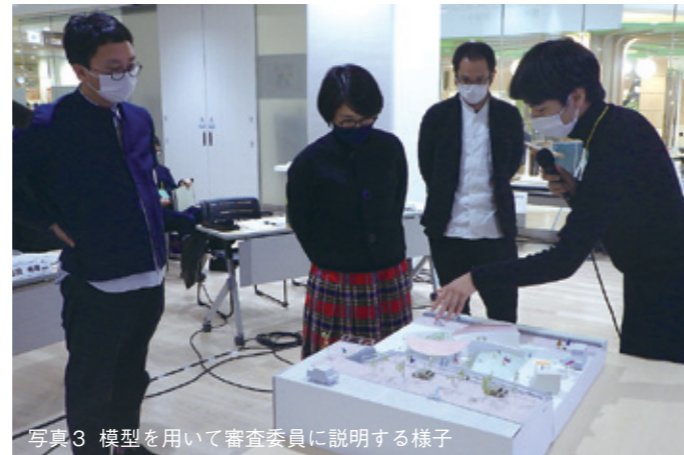
写真3 模型を用いて審査委員に説明する様子