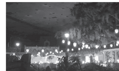
カリブの海賊から観るゲストのいないブルーバイユー・レストラン

今回は、慌ただしくなりがちな東京ディズニーランドでの、ゆったりとした過ごし方を紹介したいと思います。