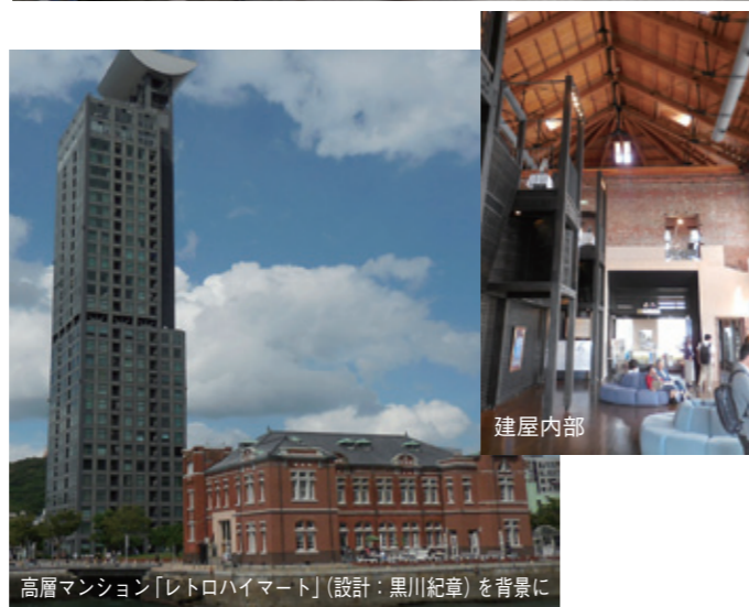
高層マンション「レトロハイマート」(設計:黒川紀章)を背景に