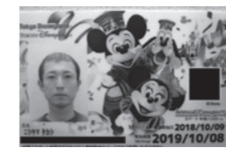
2パーク年間パスポート

学会では『情緒的サービス』『経営理念』等を学んだり、建築の『計画』『環境』『設備』『法規』『構造』『施工』に関する気づきも得ています。そんなこんなで、長年の夢だった東京ディズニーリゾートの2パーク年間パスポートの2パーク(ランド&シー)年間パスポートを取得し、プライベートも含めて、この1年で40回以上ディズニーを訪れました。