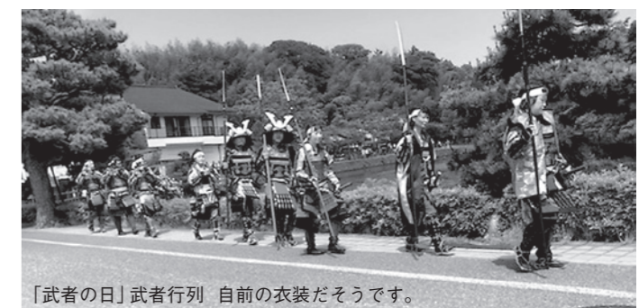
「武者の日」武者行列 自前の衣装だそうです。

私たちは「松江の城下を歩こう」に参加しました。この日はちょうど「第4回 松江 武者の日」と重なり、武者がさっそうと歩いておられる中、松江城山稲荷神社や第2次世界大戦中に県庁職員を避難させるために掘られ、最近発見されたばかりの防空壕、そして地元で人気の雑貨店などに連れて行っていただきとても楽しい時間を過ごすことができました。