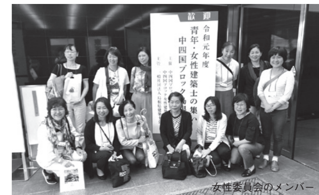
女性委員会のメンバー