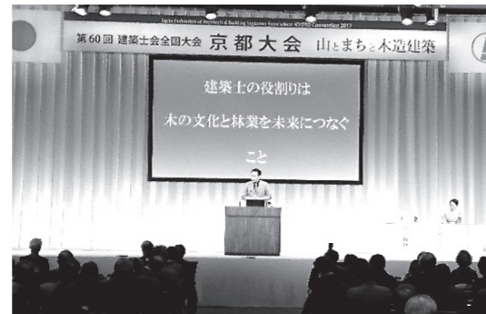
記念フォーラム リリーススピーチ