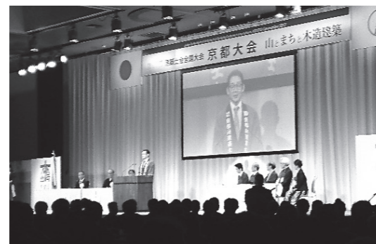
大会式典 開会あいさつ