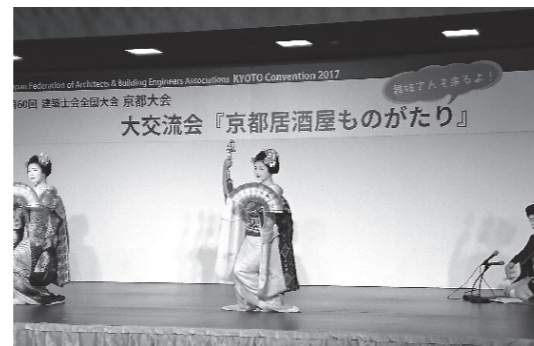
大交流会 舞妓さんたちの踊り披露