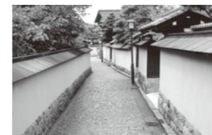
長町武家屋敷