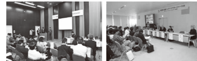
(左)情報交換セッションイメージ (右)全国ヘリテージマネージャー大会イメージ

(士会会員には若干の費用補助があります。但し、「大会式典」には必ず参加して下さい。)