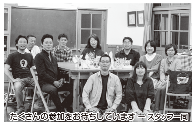
たくさんの参加をお待ちしていますースタッフ一同

広島県建築士会 社会活動委員会 青年部会・女性部会が活動を重ねてきた中で考えたこと、気付いたことを基にテーマを決め、準備を進めてきました。また、文化の遺伝子が色濃く残る尾道を知って頂けるよう、いろいろな企画を予定しています。土曜日の大会はもちろん、日曜日のフィールドワークはご家族やお友達と一緒に参加されてみませんか？尾道再発見の旅ができるかもしれません。ぜひ登録の上、ご参加下さい。(大会HP http://den2015.com/ )