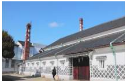
【エクスカーション：西条酒造施設】