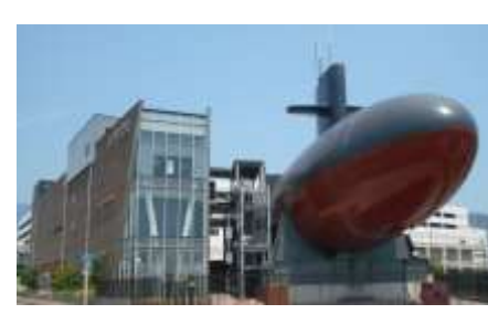
【エクスカーション：鉄のくじら】