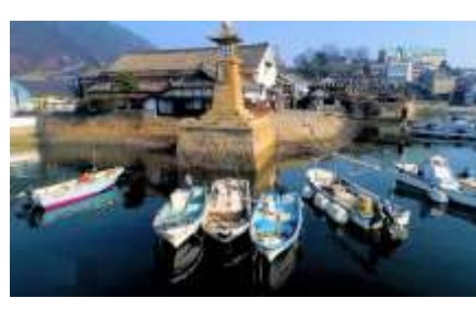
【エクスカーション：鞆の浦】