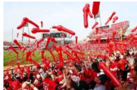
【ひろしままちづくりセッション】