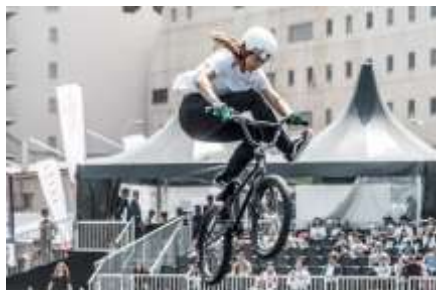
【大会式典：BMX（アーバンスポーツ）】